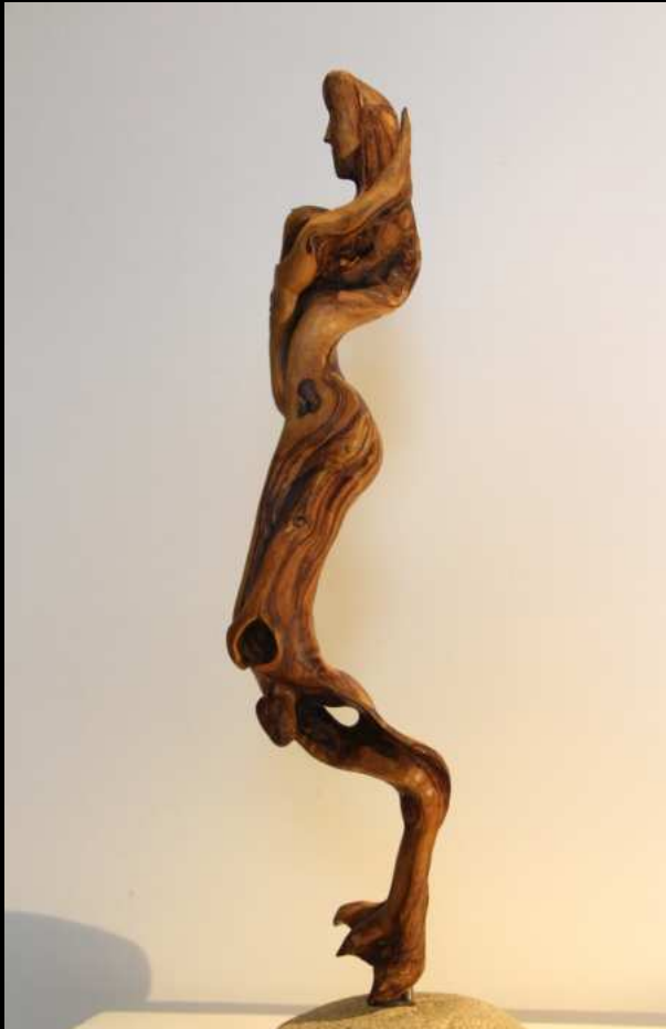
Enfantement diabolique - 45cm