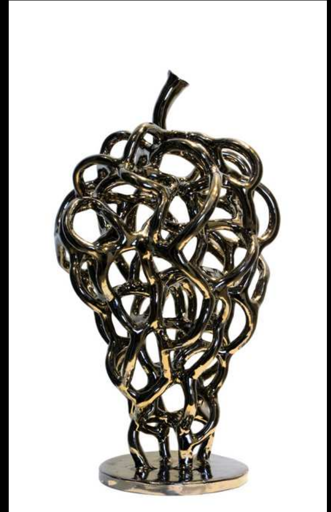
Botrus Chrome - 40 cm