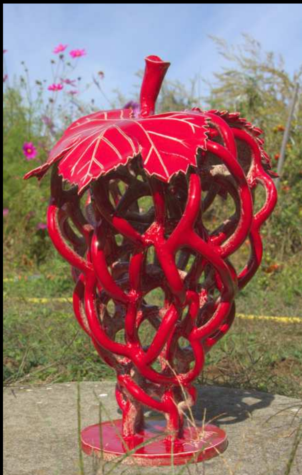
Botrus Groseille - 40 cm

Sculptures sur le thème de la grappe, céramique émaillée, bronze.