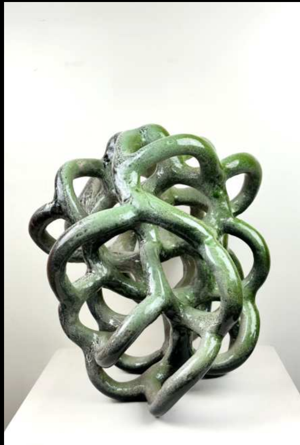
Nodulus sans patte - 35 cm