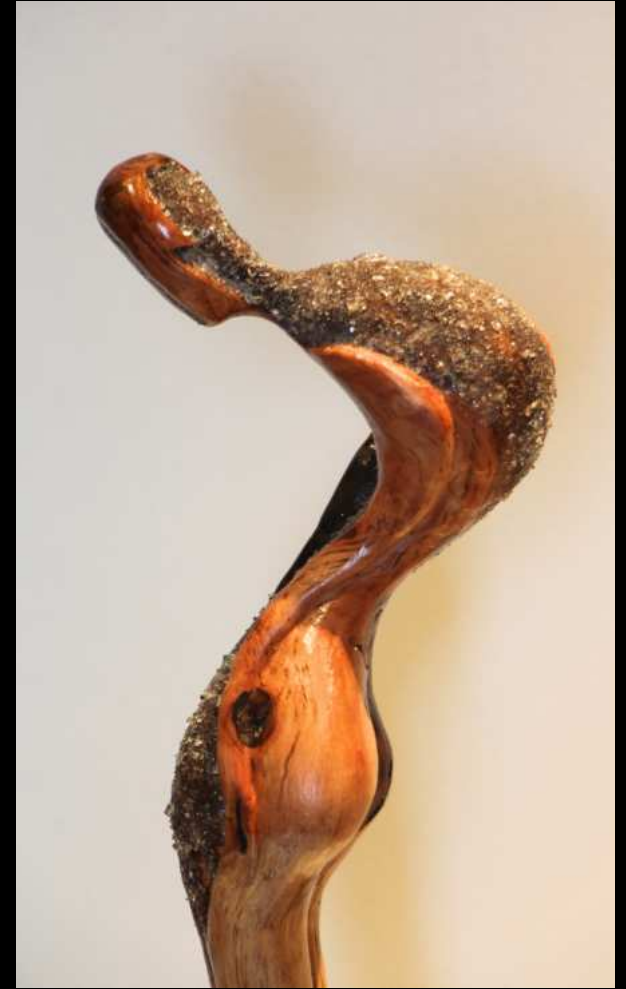
Corps en Observation - 55cm