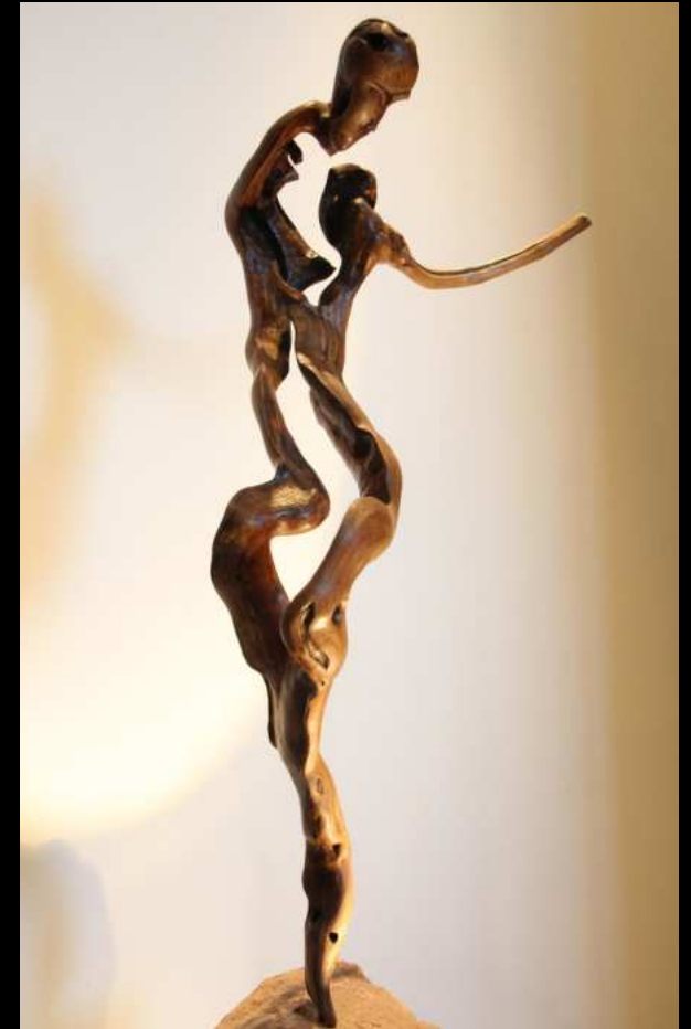
Figure christique - 65 cm