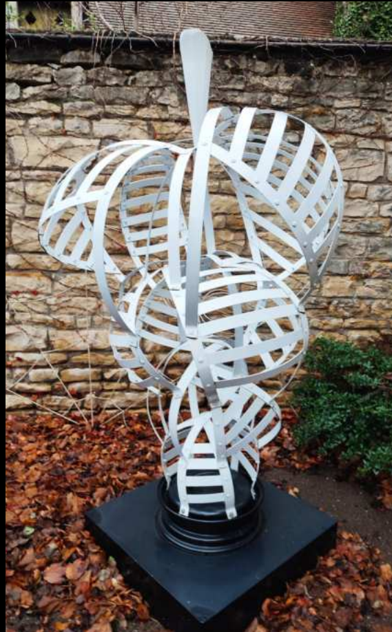
Nodulus Acier Blanc - 2,30m