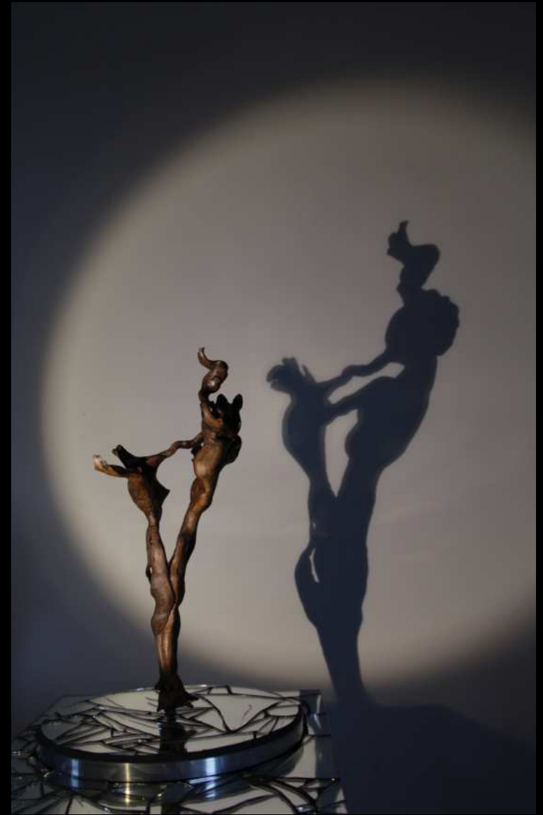
Les danseurs - 48cm