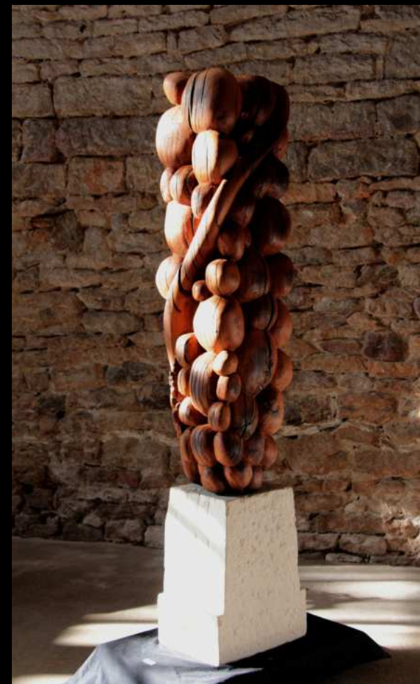
Tantique I - 2,20 m