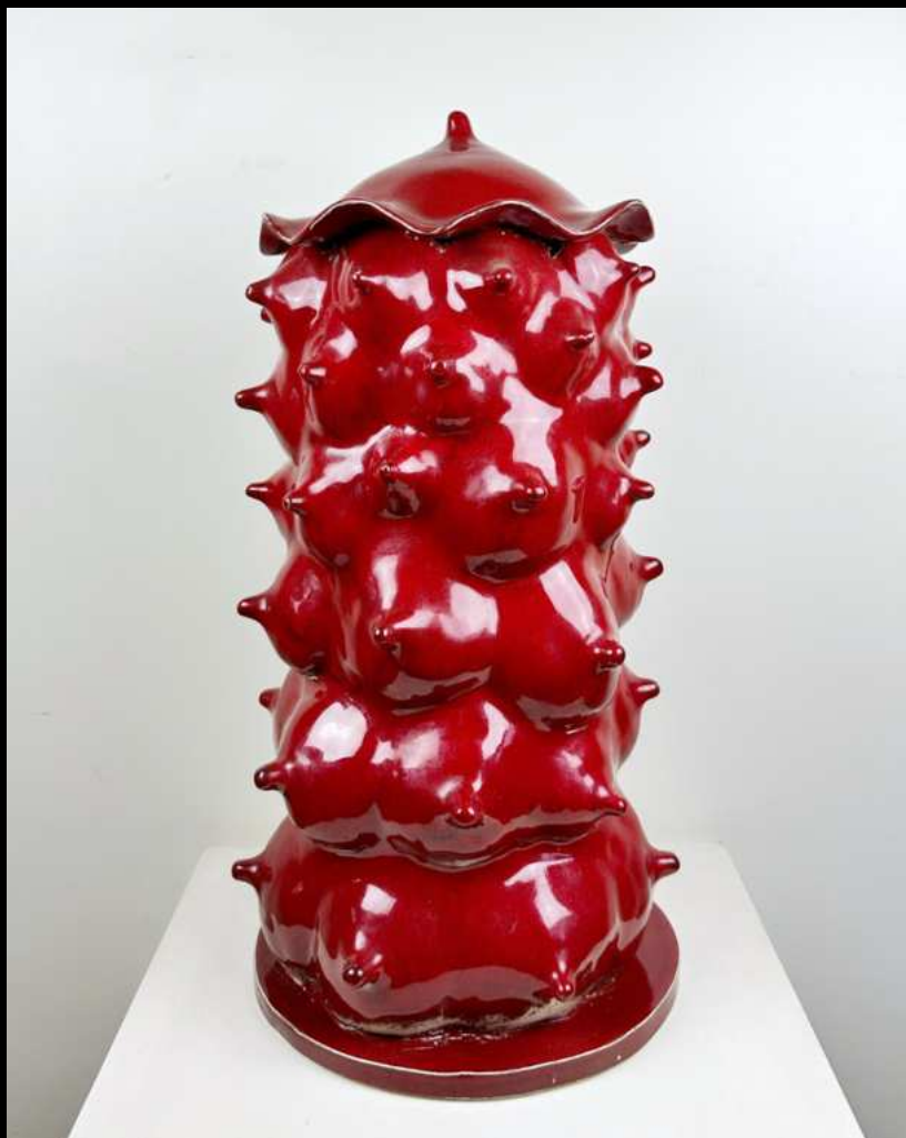
Totem de seins - 50 cm

Avec sa série Sinus en céramique émaillée, Stéphane Desmaris renoue avec son cursus en psychanalyse et met en avant ce que Freud appelait l'objet du désir.