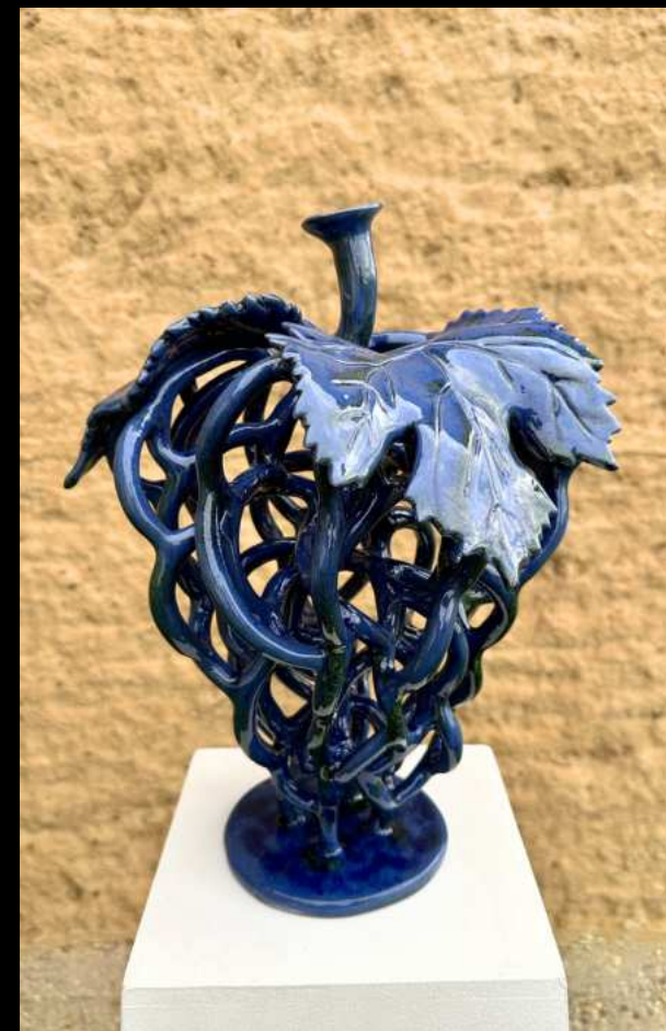
Botrus Bleu Azur - 40 cm