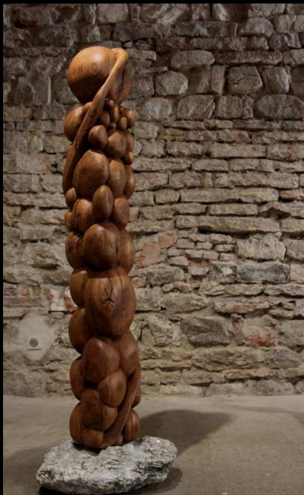
Tantique II - 1,80 m

Sculpture en bois (chêne, cerisier, tilleul)