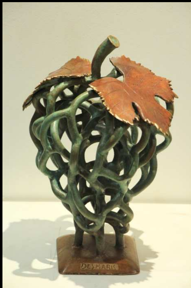
Botrus Bronze - 40 cm