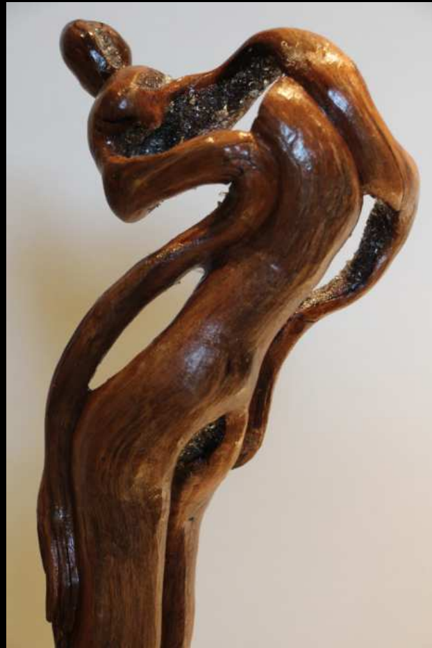
Corps aux jambes allongées - 56cm