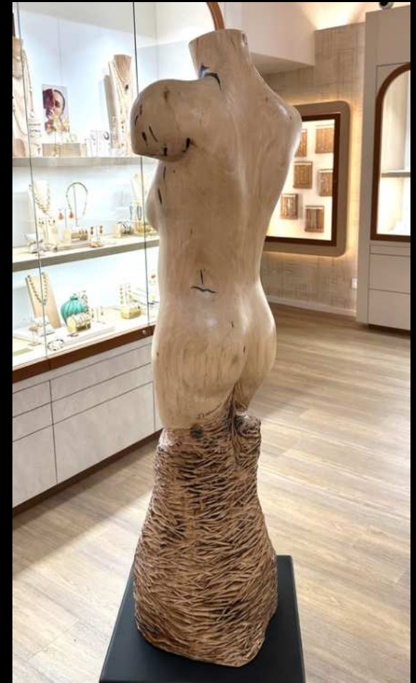
Busta I - 1,65m