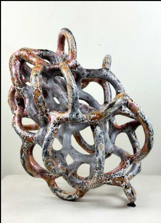
Nodulus sans patte - 35 cm

Sculptures abstraites, céramique émaillée