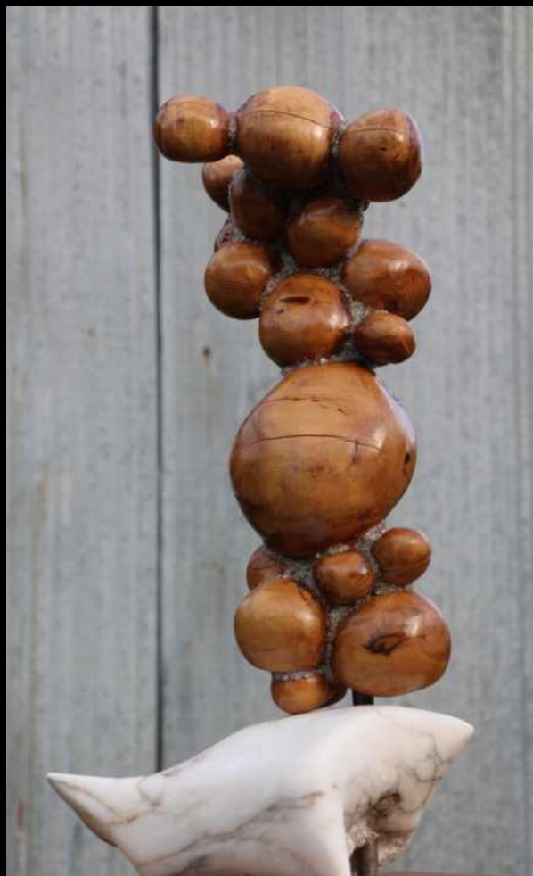
Tantique IV - 75 cm