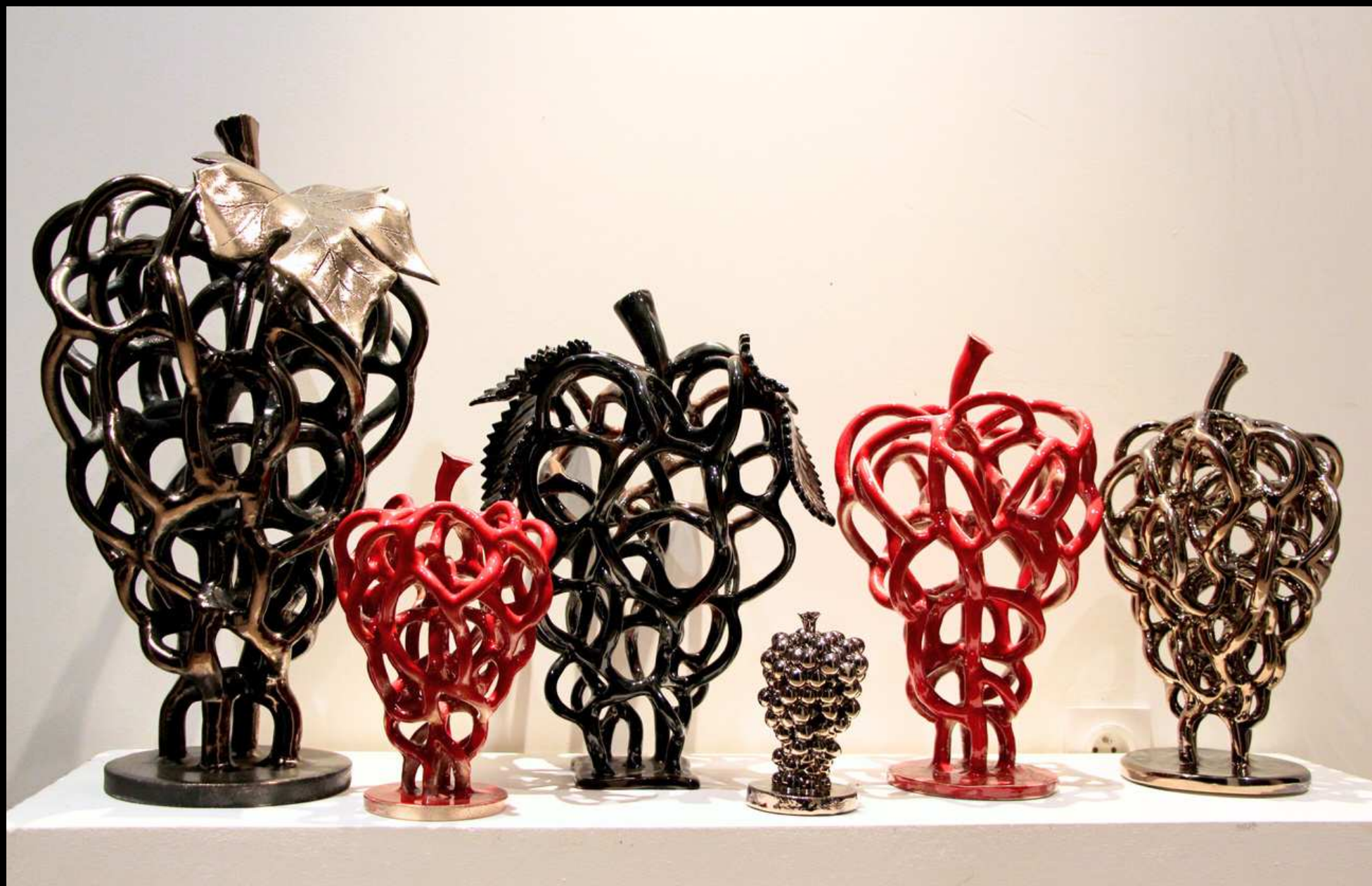
Série Botrus, céramique émaillée, de 20 à 55 cm