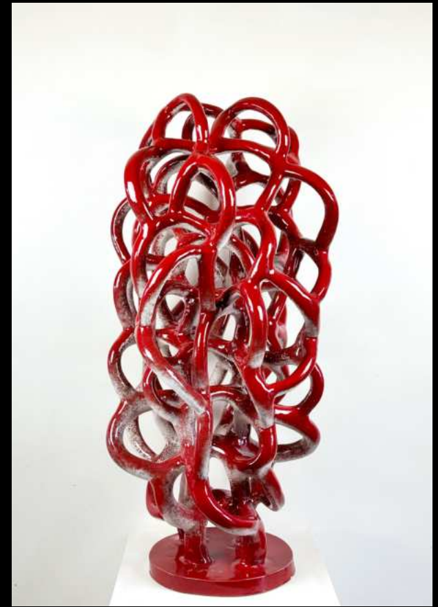
Grandis Nodulus rouge - 80 cm