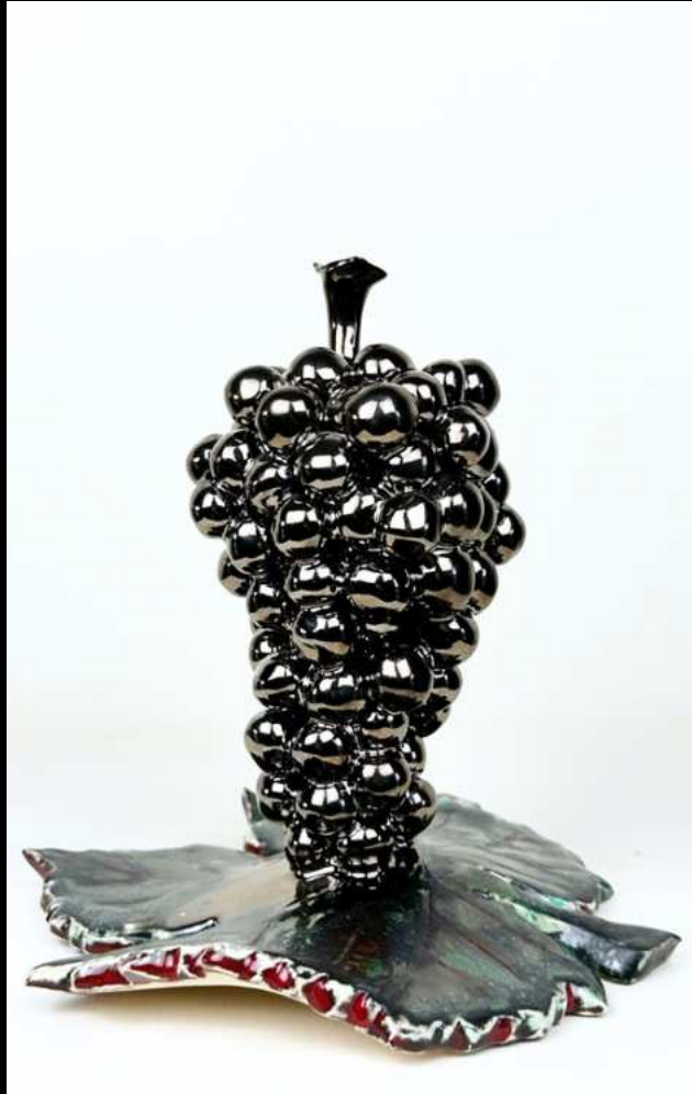
Réalis Botrus - 20 cm