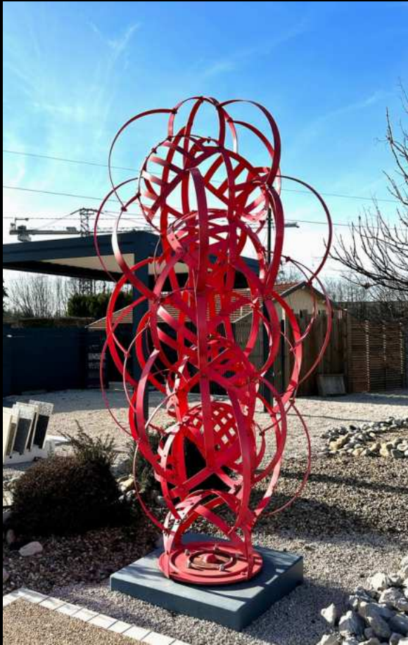
Nodulus Acier Rouge - 3,50m

Conçues pour s'adapter dans les espaces extérieurs, telle une végétation contemporaine qui ne subira pas les outrages des saisons, la matière vient embrasser le vide qu'elle entoure et le met en valeur.