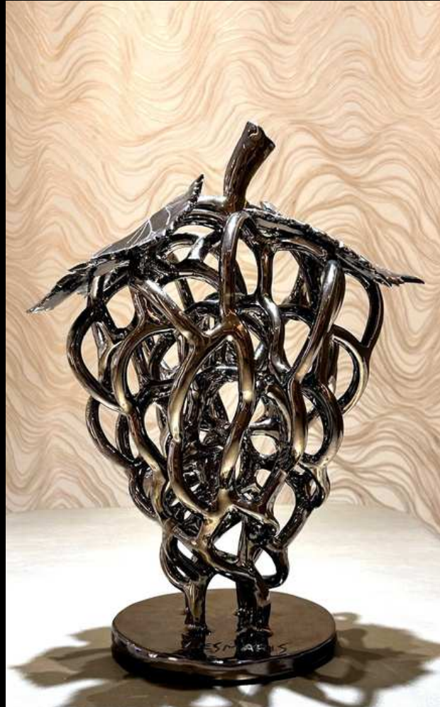
Botrus Chrome - 40 cm